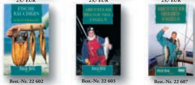
Best.-Nr. 22 602 25,- EUR Best.-Nr. 22 603 25,- EUR Best.-Nr. 22 607 25,- EUR