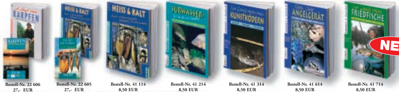
Bestell-Nr. 22 606 27,- EUR Bestell-Nr. 22 605 27,- EUR Bestell-Nr. 41 114 8,50 EUR Bestell-Nr. 41 214 8,50 EUR Bestell-Nr. 41 314 8,50 EUR Bestell-Nr. 41 614 8,50 EUR Bestell-Nr. 41 714 8,50 EUR