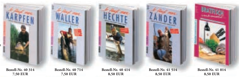
Bestell-Nr. 40 314 7,50 EUR Bestell-Nr. 40 714 7,50 EUR Bestell-Nr. 40 414 8,50 EUR Bestell-Nr. 40 514 8,50 EUR Bestell-Nr. 41 014 8,50 EUR

Bestellen Sie mit nebenstehendem Coupon.