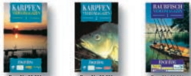
Best.-Nr. 22 201 25,- EUR Best.-Nr. 22 801 25,- EUR Best.-Nr. 22 901 25,- EUR